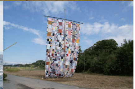
上段：北澤潤《リビングルーム》2010年