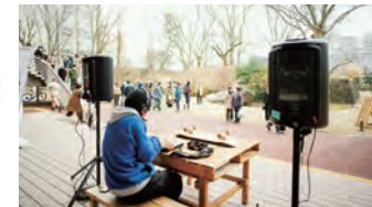
1F デッキ・屋外エリア